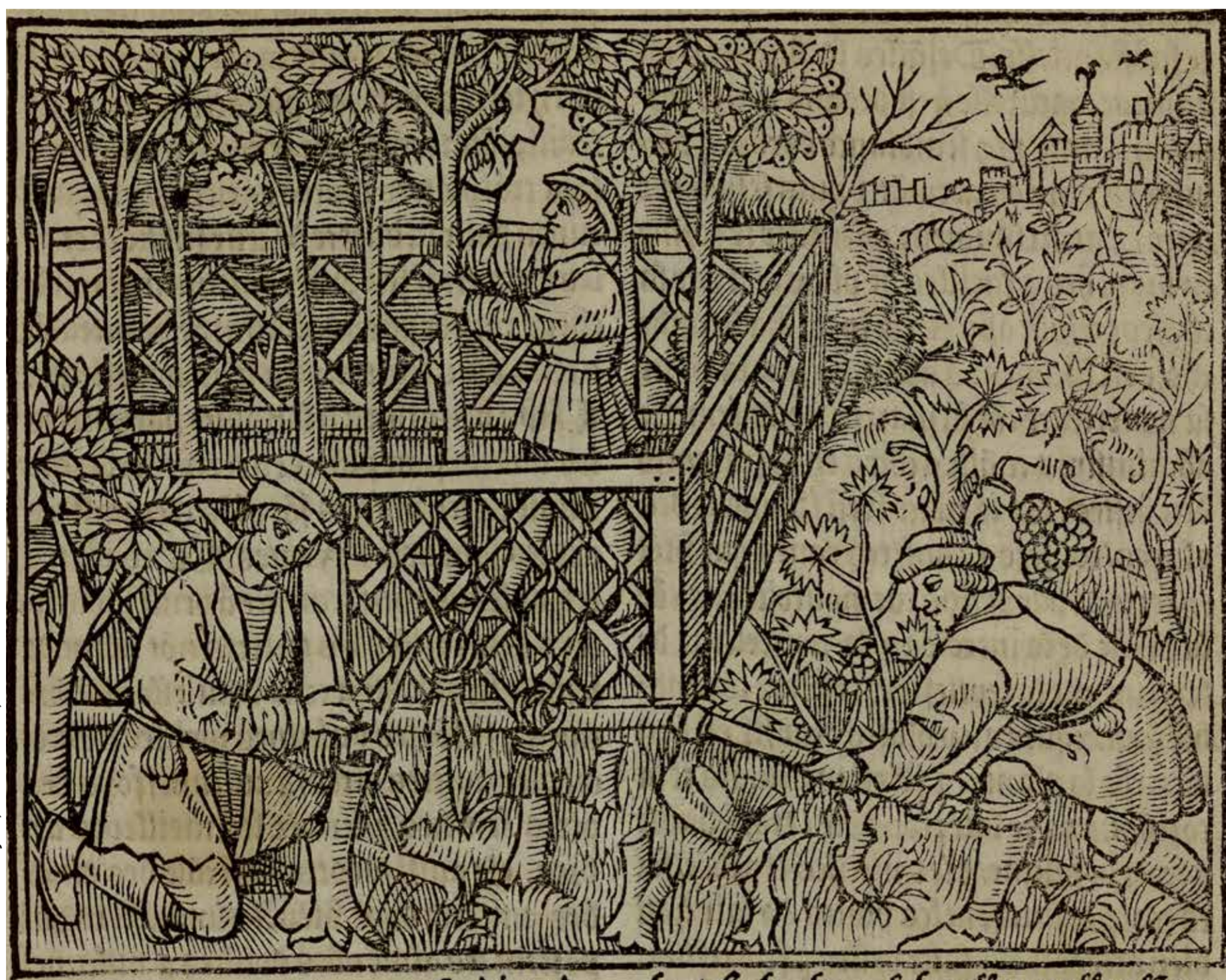
Pietro de Crescenzi. Le livre des prouffitz champêtres et ruraux, 1539 Collection Bm Lyon, Rés 317841, f. 10r.

À l'occasion de la mise en ligne de l'exposition virtuelle Le ménage des champs : du savoir agricole antique aux livres d'agriculture de la Renaissance , cette table-ronde réunira des participants qui, dans leurs pratiques ou leurs recherches, sont amenés à réfléchir aux usages qui peuvent être faits aujourd'hui des savoirs agricoles anciens.